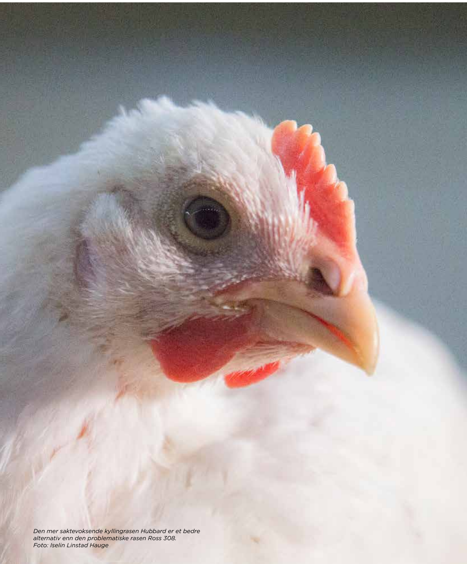
Den mer saktevoksende kyllingrasen Hubbard er et bedre alternativ enn den problematiske rasen Ross 308.