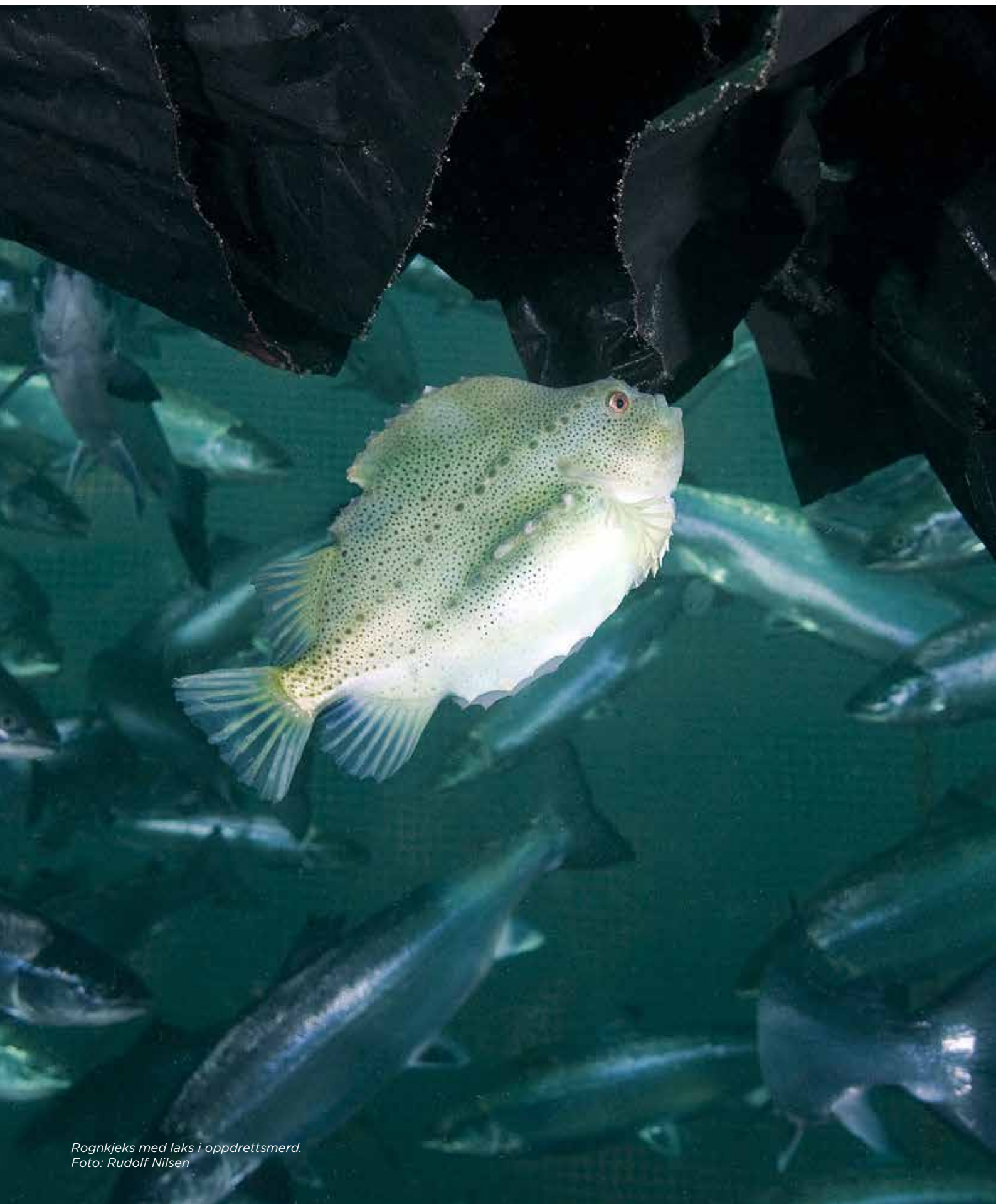
Rognkjeks med laks i oppdrettsmerd.