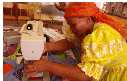
Foto: Parent teacher prøver skolens nye symaskin

Kostnader hele prosjektperioden: 6.244.470 Kostnader 2011: 1.379.507