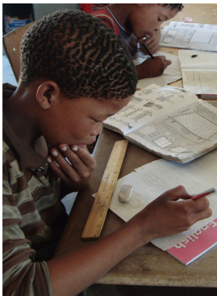
Foto: San-gutt jobber med skolearbeid på en landsbyskole utenfor Tsumkwe

Kostnader hele prosjektperioden 14.158.665 Kostnader 2011: 1.300.591.