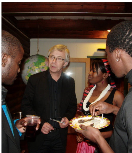
Foto: Fra Namibiakveld i internasjonalt senter i Namibiahuset.

I 2011 har innholdet på hjemmesiden variert fra markedsføring av egne arrangementer og prosjekter til nyheter om urbefolkning fra hele verden. I tillegg kommer vår grunnleggende informasjon om Namibiaforeningens arbeid og organisasjonsform. Hjemmesiden er Namibiaforeningens ansikt utad og får sterkere og sterkere prioritet. I tillegg til hjemmesiden ble facebook brukt som en