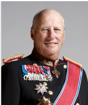
H. M. Kong Harald V Nasjonalforeningen for folkehelsens høye beskytter