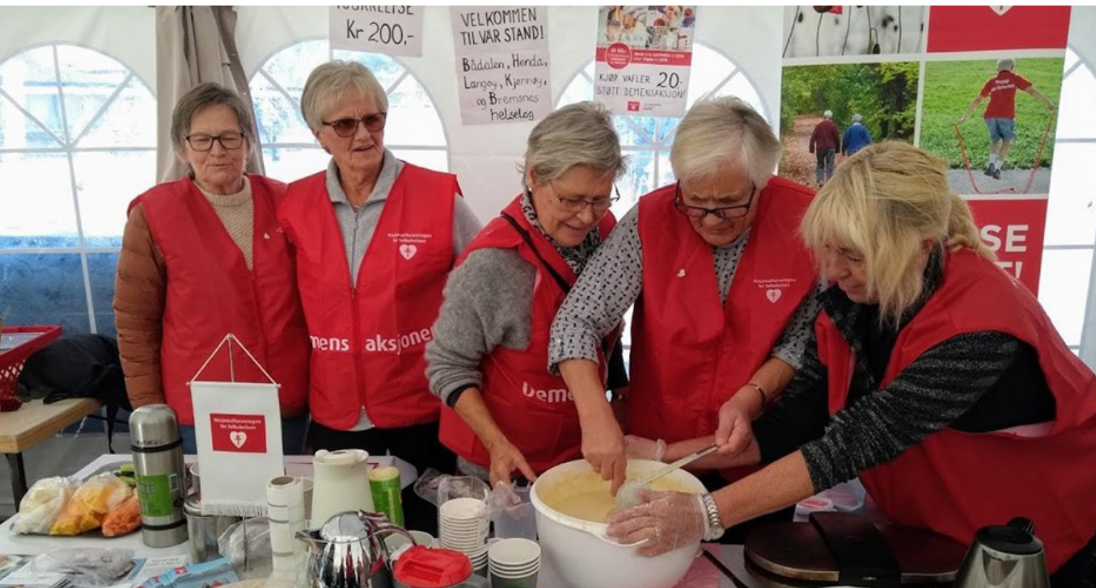
Stand er noe mange av lokallagene tar i bruk for å gjøre seg synlig i lokalsamfunnet, og noen steder samarbeider man på tvers. På Framsnakkingsfestivalen på Averøy stilte Nasjonalforeningen Bådalen, Henda, Langøy, Kjønnøy og Bremsnes helselag opp med felles stand. Her ble det solgt vaffel, kaffe og delt ut gratis frukt. .

Disse tiltakene er tidligere finansiert hovedsakelig med midler fra TV-aksjonen i 2013. Aktivitetsvenn har også mottatt støtte via Helsedirektoratet, men mindre enn tilsvarende aktiviteter i andre organisasjoner.