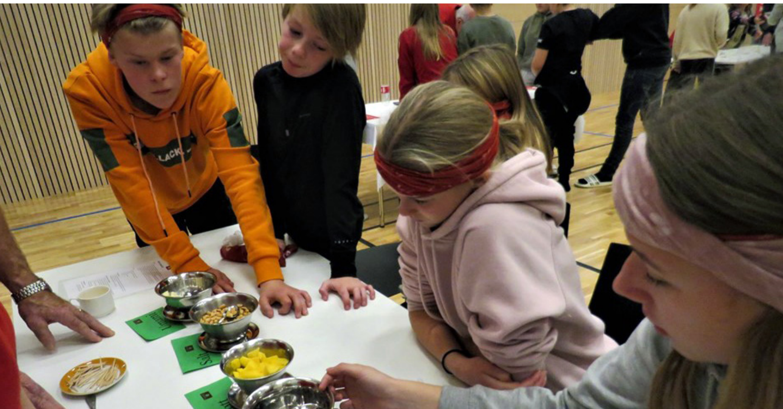
Nasjonalforeningen Ytterøy helselag arrangerte en matkarusell for elevene i mat- og helsefagtimen. Her fikk de utfordret smakssans og luktesans, bli bedre kjent med brødskalaen, lære mer om kildesortering og utforske ulike typer frukt og grønt. Både elever og lærere var meget fornøyd med dagen.

Informasjon og helsefremmende aktiviteter Store deler av organisasjonen deltok i Nasjonalforeningen for folkehelsen hjerteuke i mai. 130 lokallag deltok med hjertemarsjer, quiz-løyper og annen fysisk aktivitet på tvers av generasjoner, og mange besøkte skoler med skolefrokost, skolelunsj eller servering av frukt og grønt. Fylkeslagene i 17 fylker delte