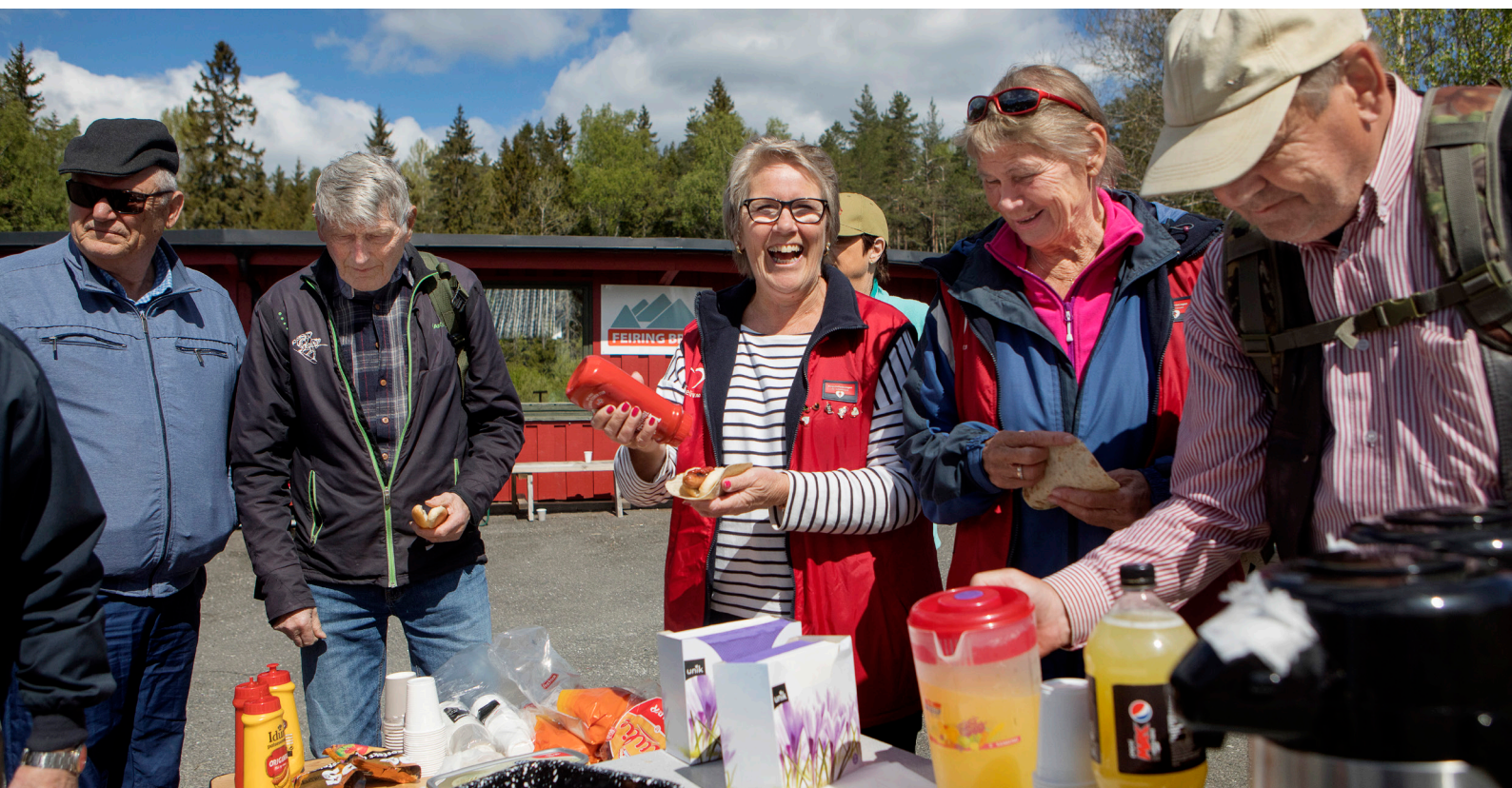
Pølser, saft og kaffe hører med når Nasjonalforeningen Enebakk helselag arrangerer sin årlige hjertemarsj.

Virkningene av covid-19 medfører noe usikkerhet rundt Nasjonalforeningen for folkehelsens innsamlingsarbeid i 2020,