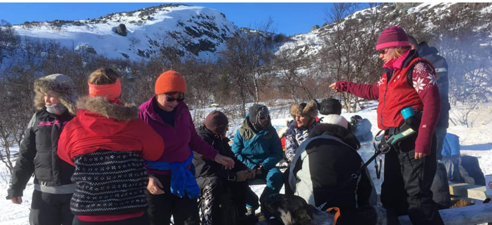
Nasjonalforeningen Bugøyens helselag inviterte til å møtes rundt et bål på fjellet, og fikk med seg unggutter, fedre, bestefedre, enslige menn, kjærester og nyinflytta lærere opp. Folk gikk på ski, kjørte skuter, det ble pilket på isen, spist fjellburger og drukket bålcaffe. En flott søndagstur en solskinnsdag i mars med Marivann.