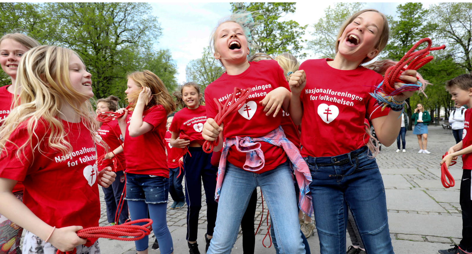
Hopp for hjertet er vårens vakreste eventyr. For tolvte året på rad hoppet elever fra hele Norge seg gjennom to uker. Over 90 000 elever fra over 1 400 skoler deltok i 2019.

For å utjevne sosiale helseforskjeller er vi opptatt av å styrke helsestasjoner